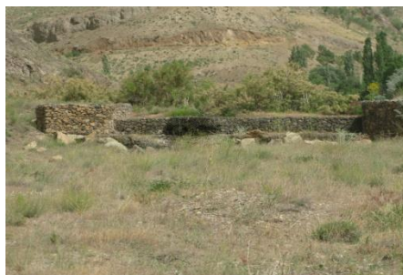
شکل ۳- نمایی از گابیون در ابراهه اصلی

در این حوضه تعداد ۴۸ بند گابیون مورد اندازه گیری قرار گرفتند. رسوب انباشت شده در آنها ۲۸۹۲۲ متر مکعب بدست آمد. این سازه‌ها همانند سد عمل کرده و آب را در خود ذخیره می‌کنند به هم‌ین علت مخازن این سازه‌ها محیط مناسبی برای کشت انواع درختان خصوصاً انواع مثمر ایجاد کرده است که می‌تواند به‌لحاظ اشتغال زایی مهم باشد. شکل (۳) نمایی از گابیون در ابراهه اصلی را نشان می‌دهد.