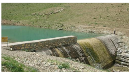
شکل ۴- نمایی از بند سنگ و سیمان ساخته شده در حوضه هفتان

تعداد بندهای سنگ و سیمان حوضه ۱۰ عدد بوده و رسوب مخزن آنها ۱۸۹۳۶ متر مکعب برآورد شده است. در حوضه سازه‌های سنگ و سیمان بعد از بندهای گابیونی احداث می‌شوند که هدف ساخت آنها جمع‌آوری هرزآب‌ها به منظور استفاده در بخش کشاورزی می‌باشد. شکل (۴) نمایی از بند سنگ و سیمان ساخته شده در حوضه هفتان است.