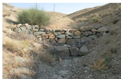
شکل ۲- نمایی از خشکه چین در حوضه هفتان

باتوجه به نقشه و بررسی های ۸۴ صحرایی سازه خشکه چین مورد اندازه گیری قرار گرفتند. بندهای اصلاحی خشکه چین از چیدن تخته سنگ ها روی هم و در عرض آبراهه ساخته می شوند. هدف اصلی این بندها کنترل فرسایش در طول آبراهه و متوقف کردن فرسایش آبخیزی با تثبیت کردن پیشانی آبراهه است در این بررسی حجم رسوب مخزن آن ها ۲۵۳۰ مت مکعب بدست آمده است. شکل (۲) نمایی از خشکه چین را نشان می دهد.